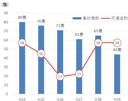
【遊漁船の事故隻数と死傷者数の推移】